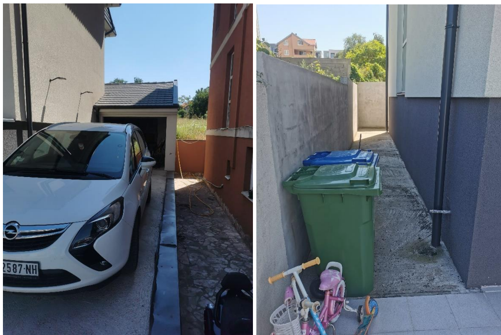
Nedostaje ograda oko dvorišta