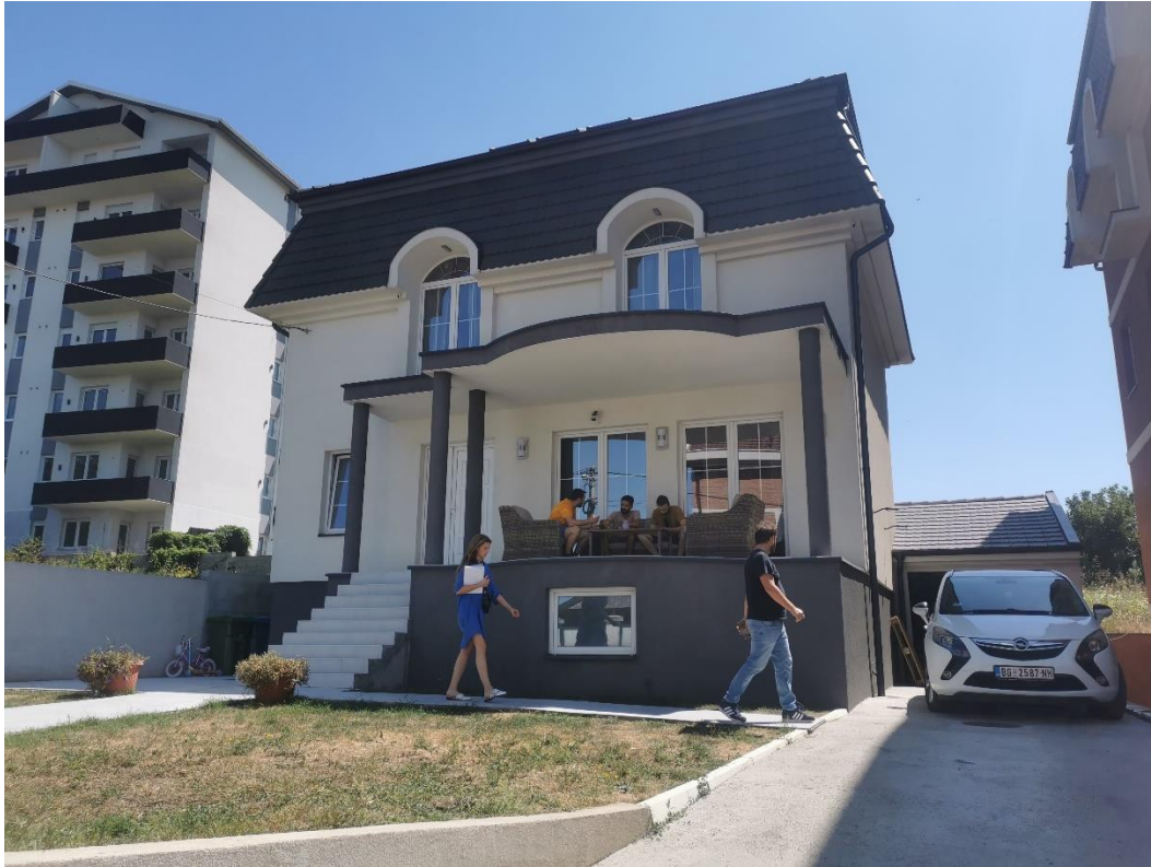
Severozapadna fasada objekta