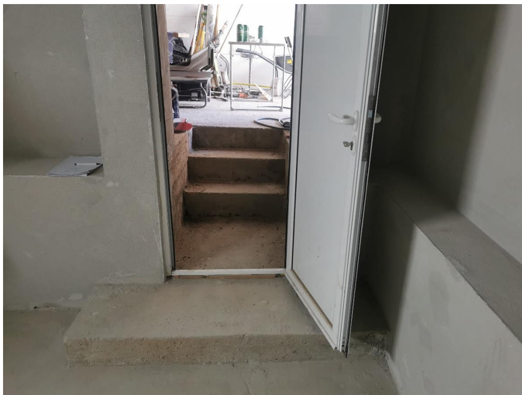
U podrumu je potrebno postaviti podnu i zidnu keramiku